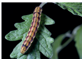
Larva de Heliothis armigera

SANIDAD AGRÍCOLA ECONEX, S.L. garantiza, únicamente, la composición, formulación y contenido de los productos, siendo responsable de los daños y perjuicios que tengan su causa directa, inmediata y exclusiva en la composición, formulación y contenido de los productos comercializados. SANIDAD AGRÍCOLA ECONEX, S.L. no tendrá ninguna responsabilidad por los daños en cuya producción haya contribuido, total o parcialmente, factores ajenos a la empresa como pueden ser, a modo de ejemplo, la climatología, la aplicación o la mezcla con otros productos. Asimismo, SANIDAD AGRÍCOLA ECONEX, S.L. facilitará recomendaciones e información sustentada en amplios y rigurosos estudios y ensayos, que deberán ser observadas por el usuario en la utilización de los productos. El usuario será responsable de cualquier daño causado, en todo o en parte, por la inobservancia total o parcial de las instrucciones facilitadas, siendo responsable, asimismo, de todo lo que se refiera a la eficacia final de los productos, que tenga su origen en la inobservancia total o parcial de las instrucciones e información facilitadas por la empresa.