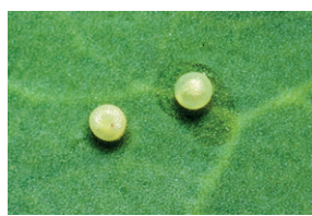
Huevo de Heliothis armigera

El ciclo completo dura de 30 a 40 días, y la plaga puede tener varias generaciones al año, dependiendo de las condiciones climáticas. Pueden encontrarse simultáneamente adultos, huevos, larvas y crisálidas. Su capacidad para adaptarse a diferentes ambientes y la rapidez de su ciclo de vida la convierten en una plaga altamente dañina para una gran variedad de cultivos.